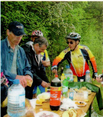
Contrôle de Heucheloup.

Dounoux nous a rendu visite pour la remise des coupes.